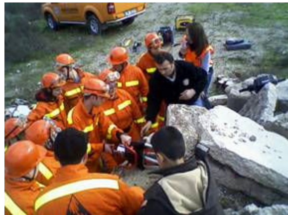
Resim 3 Yalova Merkezi Eğitiminde enkaz çalışması Şubat 2010

2010 yılı içerisinde çeşitli bölgelerdeki MAG dernekleri ile koordineli bir şekilde 5 merkezde Merkezi Eğitim yapılması planlanmış, uygulamada ise Yalova Merkez ilçede ilk eğitime katılımın az olması nedeni ile ikinci bir kez eğitim organize edilmesi neticesinde 6 adet merkezi eğitim gerçekleştirilmiştir. Yalova, Kocaeli ve İstanbul'un çeşitli ilçelerinde gerçekleştirilen eğitimler neticesinde 188 MAG Gönüllüsü mahallerindeki ekiplere dahil