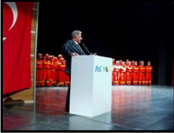
Resim 2 Gebze sertifika töreni Aralık 2010

2010 yılı için 15 yeni mahallede Mahalle Afet Gönüllüsü yapılanmasının oluşturulması öngörülmüştü. Ocak 2011 itibari ile 12 mahallede MAG uygulamalarını tamamlanmış, 2 mahalledeki uygulama Bursa Valiliği kaynaklı gecikme, bir mahallede (Tuzla Aydınli) ise gönüllü kapasitesinin yaratılmasında ortaya çıkan gecikmelere nedeniyle ile bütçesi ile birlikte 2011 yılına devredilmiştir.