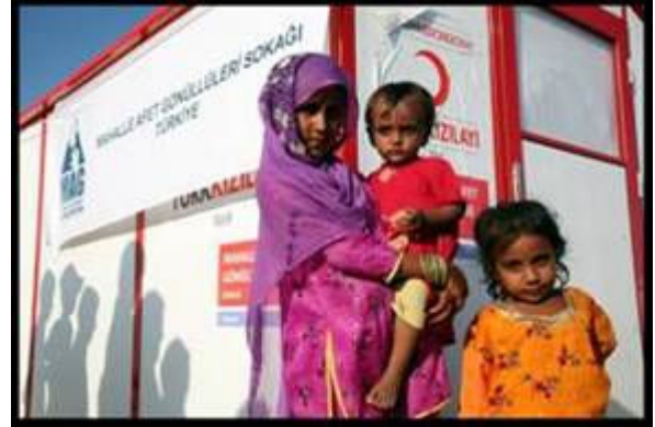
Resim 6 Pakistan'da sel felaketzedeleri kurucularımızdan sağlanan destek ile oluşturulan Mahalle Afet Gönüllüleri.Sokağında Kasım 2010

Pakistan'da yaşanan sel felaketini takiben kurucularımızın ve gönüllülerimizin desteği ve Kızılay aracılığı ile 16 adet Mevlana Evleri tipi geçici barınak ve çeşitli yardım malzemeleri bağışlanmıştır. Bu barınaklar ile Pakistan'da Nowshera bölgesindeki bir geçici yerleşim bölgesinde bir Mahalle Afet Gönüllüleri Sokağı oluşturulmuştur. Bağışlanan yardım malzemeleri Kızılay'ın yardım treni ile bölgeye gönderilmiştir.