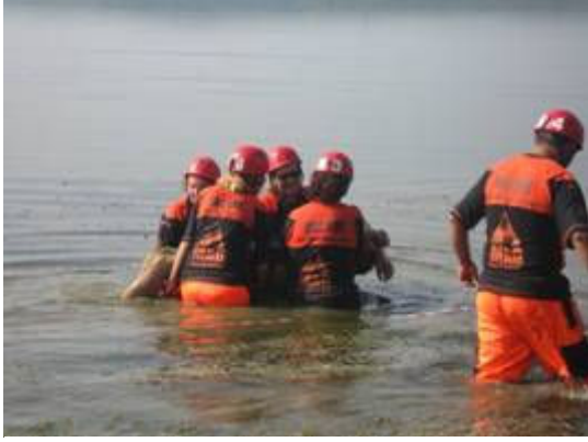
Resim 9 İstanbul MAG Acil Müdahale Ekibi su baskınlarında ilk müdahale eğitiminde

MAG Koordinasyon Kurulu, afet niteliğinde olmayan ancak MAG'ların buldukları bölgede ciddi tehdit oluşturan acil durumlarda ilk müdahaleyi yapmak üzere MAG'lar arasında