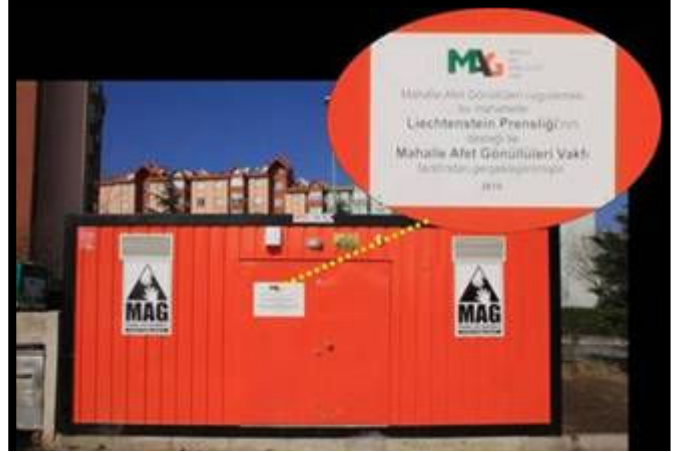
Resim 1: Esenyurt ilçesi Esenkent mahallesinde Liechtenstein fonları ile tedarik edilen MAG Konteyneri Aralık 2010

Öte yandan gene 2010 yılında İstanbul Valiliği'nce önce ilçe kaymakamlıklarına, daha sonra da ilçe belediyelerine devredilen AFIS konteynerleri ve içerisindeki takım ekipmanının Mahalle Afet Gönüllülerine tahsis edilmesi için Şişli İlçesinde yapılan protokolden sonra benzer protokoller Kağıthane, Avcılar ve Silivri ilçelerinde de hayata geçirilmiştir. Vakfımız AFIS konteynerlerinin kullanıldığı uygulamalarda gönüllü bulma ve eğitim masraflarını karşılamakta, gönüllülerin kişisel ekipmanı ile MAG standardında olup da AFIS konteynerlerinde bulunmayan eksik malzemeyi kendi kaynaklarından tedarik etmektedir.