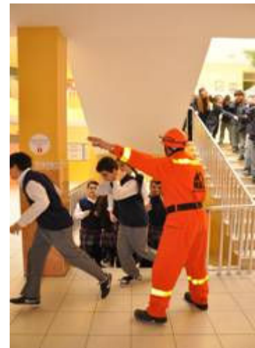
Resim 4 Bakırköy'de okul tahliye çalışması Haziran 2010

Vakfımızın temel amaçlarından biri olan toplumda afet bilincinin geliştirilmesi için, Mahalle Afet Gönüllüleri'nin kendi bölgelerinde temel afet bilincinin yayılmasına katkıda bulunması için çalışmalara devam edilmiştir. Bu çerçevede 2010 yılında Mahalle Afet Gönüllülerinin Ekim ayında İstanbul'da yeni katılan mahallelerden seçilen 17 gönüllü daha eğitmen eğitimini tamamlayarak Temel Afet Bilinci Eğitmeni olmuşlardır. Bu yeni katılımı birlikte İstanbul'daki eğitmen sayısı 93 olmuştur. Bu eğitmenlerin mahallelerindeki okullarda ve işyerlerinde yaptıkları eğitimler tüm hızıyla devam etmekte ve binlerce kişiye seminerler aracılığı ile temel bilgiler verilmektedir.