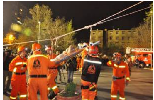
Resim 8 Ataköy gece tatbikatı

Mahalle Afet Gönüllüleri kendi bölgelerindeki yerel acil müdahale kurumları ile ortaklaşa çeşitli eğitimler ve tatbikatlar düzenlemektedirler. Vakıf bu eğitimler, kamplar ve tatbikatlara ihtiyaç