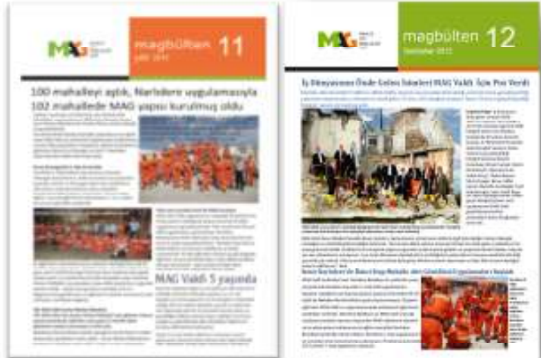
Resim 1 Yaz ve Sonbahar 2012 MAG Bülteni

MAG Vakfı, MAG ağına destek görevini yerine getirmeye devam etmektedir. Mayıs 2011’de gönüllü toplantısı ile alından stratejik karar doğrultusunda MAG Vakfı, yeni gönüllü katılımının sağlanması, MAG eğitim programının verilmesi ve mevcut mahalle ekiplerinin takibi gibi saha aktivitelerinde il bazındaki MAG derneklerini desteklemektedir. Bu bağlamda, İstanbul, Kocaeli ve Yalova’da, MAG eğitimlerinde eğitmenlik yapmak üzere bazı