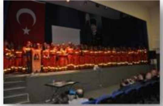
Resim 5 Çayırova’da Sertifika Töreni

2011 yılında MAG Vakfı, Kocaeli’nin Çayırova ilçesinde 3 mahallede MAG uygulaması için Procter and Gamble firması ile sponsorluk protokolü imzalamıştır. Bu çerçevede 3. Mahallenin uygulaması Nisan-Mayıs 2012 tarihlerinde, Yenimahalle mahallesinde tamamlanmıştır.