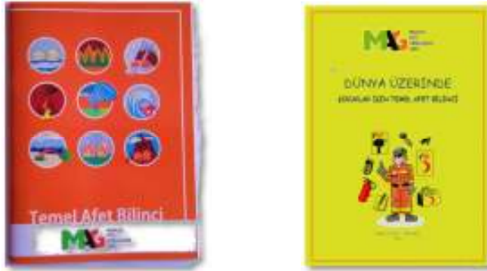
Resim 2 MAG Vakfı tarafından yetişkinler (solda) ve çocuklar için (sağda) üretilen Temel Afet Bilinci kitapçıkları

Temel Afet Bilinci'nin Yaygınlaştırılması MAG Vakfı, birincil görevi olarak, afet bilincinin toplum genelinde yaygınlaştırılması için halk eğitimlerine devam etmektedir. Bu amaçla 2012 yılında, doğal afetlere karşı önlem alma, hazırlıklı olma ve zararların azaltılmasıyla ilgili hayati bilgiler içeren kendi kitapçıklarını üretmiştir. Bu kitapçıklar, biri yetişkinlere diğeri çocuklara yönelik olmak üzere iki farklı versiyon halindedir. Bu kitapçıkların ilk baskıları Van'da dağıtılmıştır.