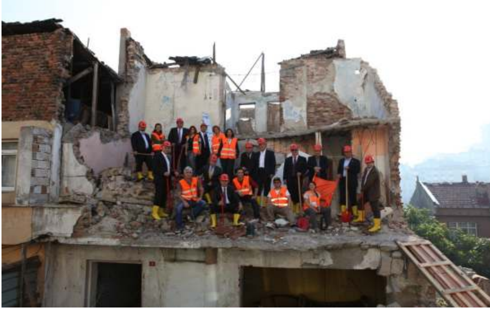
Resim 12 – Gerçekten hazırlıklı mıyız?

Buna rağmen, ufak katkılar hariç olmak üzere, vakıf giderlerini karşılamaya yetecek ölçüde koşulsuz bağış sağlamak mümkün olmamıştır.