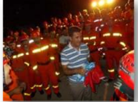
Resim 8 Şişli'de enkaz araması (solda), Belediye başkanının tatbikattan sonra gönüllüleri tebriği (sağda)

evrak işlerinin hallolmasında ofis çalışması ile yerel MAG derneklerine ve MAG ekiplerine destek olmuştur.