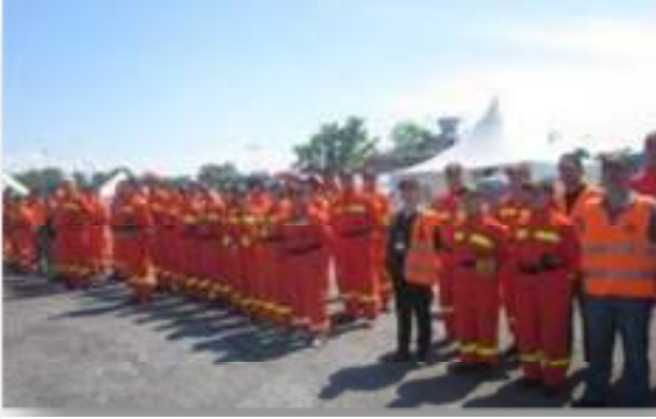
Resim 7 Zeytinburnu tatbikatında gönüllüler

İkinci tatbikat 16 Ağustos'ta Şişli ilçesinde yapılmıştır. Bursa ve Kocaeli illerinden de dahil olmak üzere yaklaşık 200 kadar MAG bu tatbikatta yer almışlardır. Bu aktivitelerde İstanbul ve Yalova'daki MAG Acil Müdahale Ekibi ile birlikte ve ilgili illerdeki diğer acil durum ekipleri de yer almaktadır.