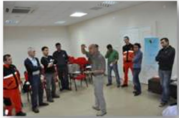
Resim 6 Toplum Afet Gönüllüsü Eğitimci Eğitimi, İzmir

İzmir Valiliği’nin talebi üzerine MAG Vakfı, Kandilli Rasathanesi Deprem Araştırma Enstitüsü’nün Toplum Afet Gönüllüsü Eğitimci Eğitimi programını organize etmiştir. İzmir’in çeşitli kamu kurumlarından gelen 15 aday, Nisan ayı sonlarında düzenlenen bu programda 3 gün süren eğitime katılmışlardır.