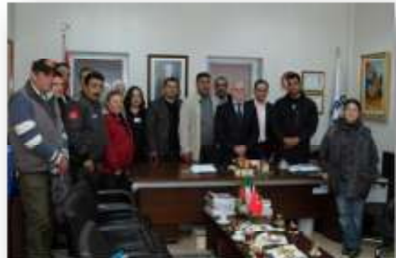
Resim 11 Ürdün'lü yetkililer Bursa AFAD'ı ziyaret ediyor

MAG Projesi dış dünyadan hatırı sayılır ilgi görmeye devam etti. Bu bağlamda bir kısım gazeteci ve çeşitli organizasyonlardan profesyoneller vakıf merkezi ile mahalleleri ziyaret etti. Bunlar arasında BBC'den, Geo Magazine'den, ZDF ve Dutch Public TV'den kişiler vardı. Öte yandan MAG Vakfı, İstanbul'da kurulacak olan "Afet Zararlarının Azaltılmasında Mükemmellik Merkezi" ni