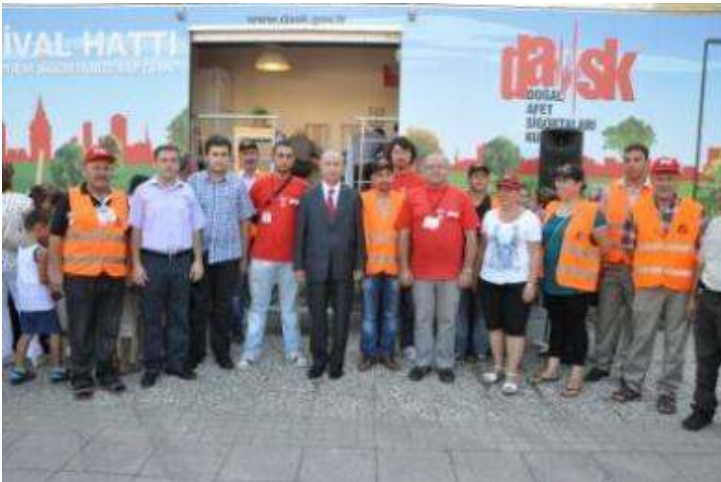
Resim 9 MAG'lar Bursa Orhangazi'de deprem simülasyonu TIR'ının önünde

Kampanyalar ve 1999 Depremi'nin Yıldönümü: 1999 depremlerinin yıldönümünde MAG Vakfı, genel halk farkındalığı için Bursa'da Doğal Afet Sigortaları Kurumu ile birlikte 2 günlük bir