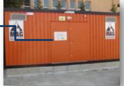
Resim 3 Avcılar İstanbul'da Merkez Mahallesi'nde MAG Merkezi

Avcılar ilçesindeki ikinci mahallenin finansmanı MAG Vakfı tarafından karşılanmıştır. İstanbul'da dördüncü mahalle uygulaması Gaziosmanpaşa ilçesinde tamamlanmıştır. Bu uygulamanın finansmanı kısmen yerel bir organizasyon tarafından karşılanırken ekipman olarak yerel belediye AFIS konteyneri temin etmiş ve eğitimler vakıf tarafından finanse edilmiştir. Beşinci mahalle, İstanbul'un Adalar ilçesinde Burgazada mahallesi olmuştur. Bu uygulamada eğitimler ve kişisel ekipman MAG Vakfı tarafından karşılanırken AFİS konteyneri ve takım ekipmanları yerel belediye tarafından temin edilmiştir.