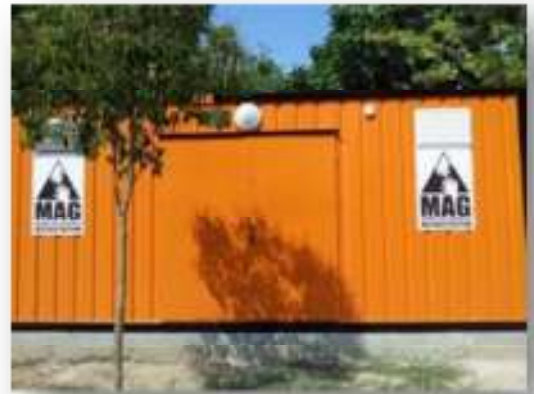
Resim 4 Orhangazi C MAG Merkezi

Gemlik ve Orhangazi ilçelerindeki yeni MAG uygulamalarını müteakip 6. MAG mahallesi Orhangazi'de tamamlanmıştır. Orhangazi'de saha çalışması ve eğitimler Mayıs-Haziran 2012'de yapılmıştır.